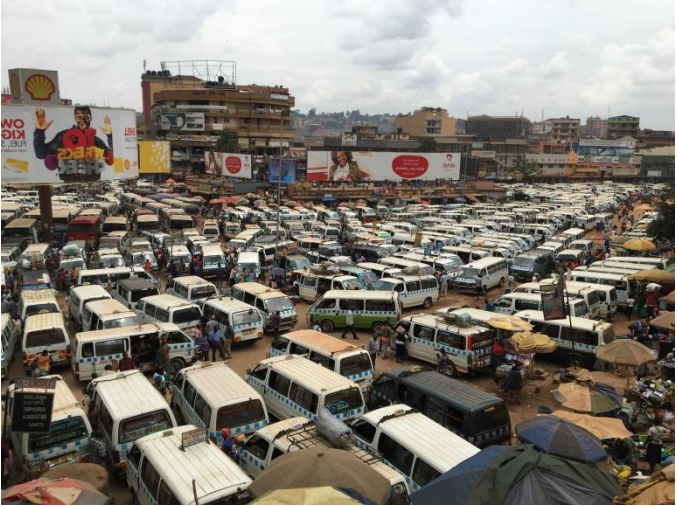
Der Old Taxi Park in Kampala vor (oben) und nach (unten) dem Lockdown.