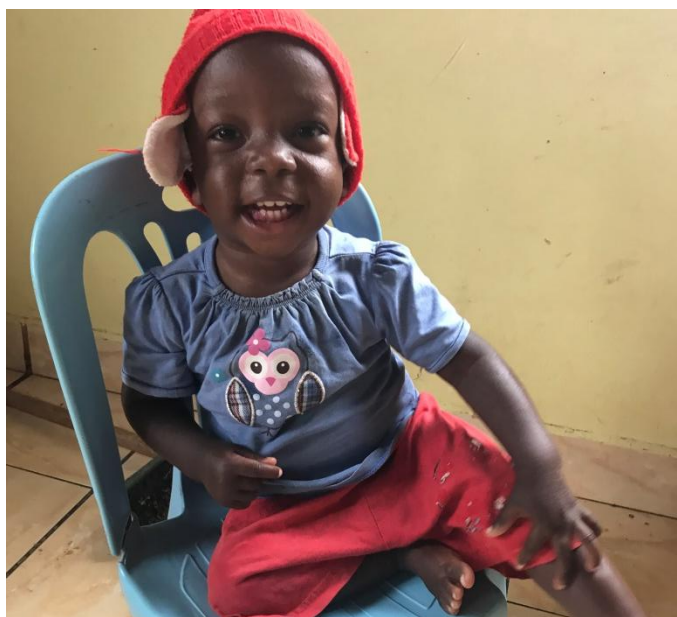
Auch trotz Corona verlieren unsere Mitarbeiter das Ziel nicht aus den Augen: Lachende Kinder dank pausenloser Betreuung und Fürsorge.