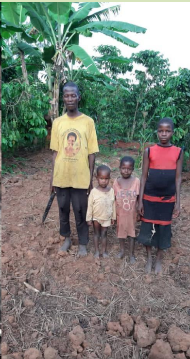
Die Familie vor ihren alten kaputten und neuem Haus