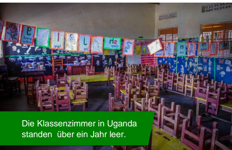
Die Klassenzimmer in Uganda standen über ein Jahr leer.

In diesem Jahr ist die Einschulung bzw. Rückkehr an die Schule für 54 Schulkinder der Grundschule Villa Maria gefährdet, da diese Spendenaktionen