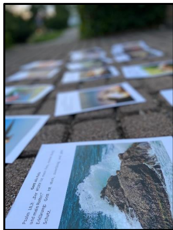
Firmvorbereitung während dem Pilgerwochenende