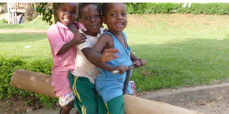
Die neue Wippe wird eingeweiht