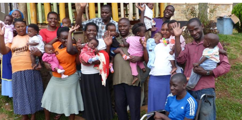
Gruppenbild – Danke an alle Spender!