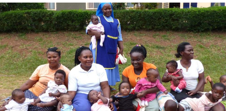
Gemeinsames Beisammensein im Garten