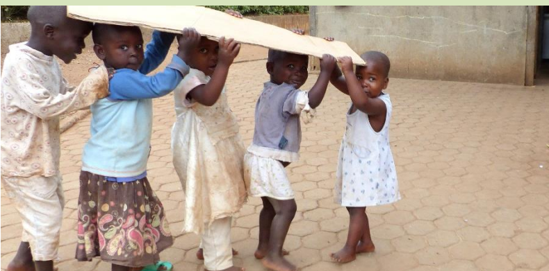
Auch ein Stück Pappe kann für Spaß sorgen