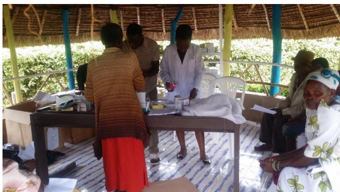
Eindrücke vom Ärzteaufenthalt aus den USA mit dem Lebenshaus als Eventstandort