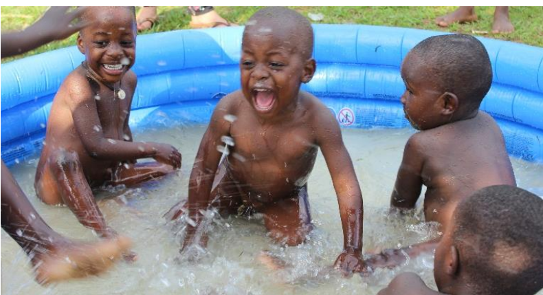
Am meisten Freude macht das Planschbecken