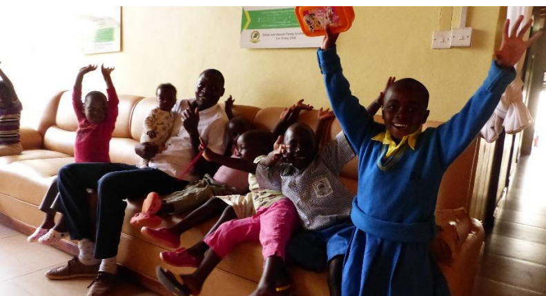
Die großen Kinder im Haupthaus